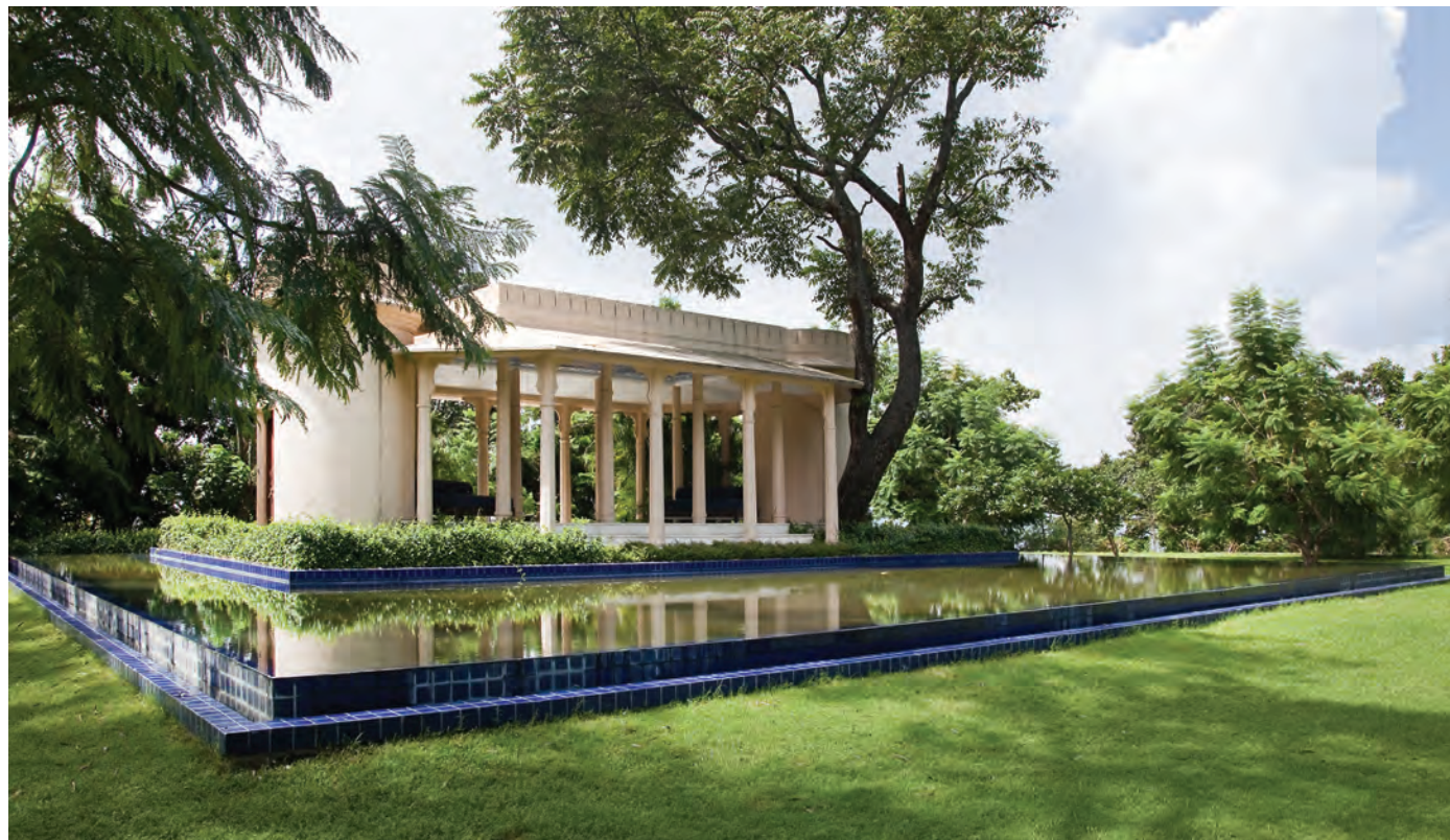
Справа: интерьер отеля Ananda in the Himalayas. Внизу: групповые и индивидуальные занятия и тренировки в отеле Ananda in the Himalayas. На странице слева: терраса для занятий йогой.